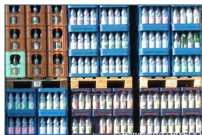
Abb. 4, 5, 6: Wer mit dem eigenen Korb auf dem Markt einkauft und Mehrwegflaschen verwendet, vermeidet Abfall.