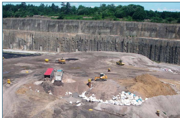
Abb. 33: Heute müssen alle organischen Abfälle vorbehandelt werden. Auf die Deponie dürfen nur mineralische Abfälle: Aschen aus der Abfallverbrennung (grau), kontaminiertes Erdreich (ocker), Abfälle aus der mechanisch-biologischen Behandlung (erdig) und Asbest bzw. künstliche Mineralfasern (Säcke).