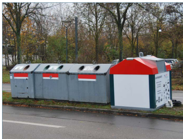
Abb. 17,18: Ob Hol- oder Bringsystem – wichtig ist, dass die Wertstoffe sortenrein gehalten werden. Nicht zulässig und strafbar ist allerdings die Ablagerung neben den Containern.

Zweifeln am Sinn der Wertstofftrennung kann Folgendes entgegnet werden: