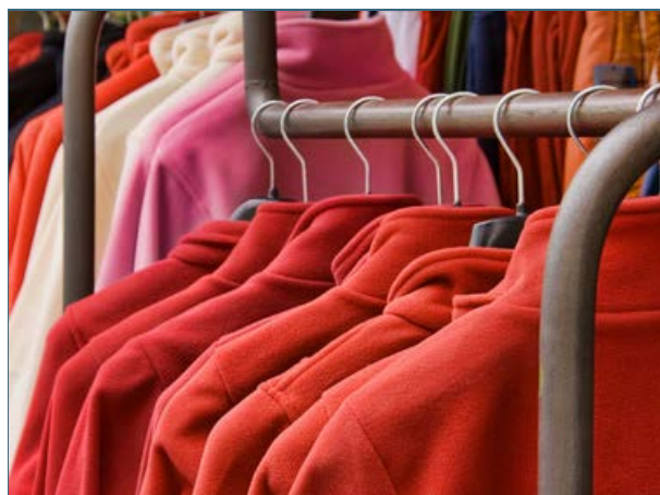
Abb. 23: Werden aus PET-Fasern Kleider hergestellt, ist der Kreislauf streng genommen bereits unterbrochen, weil diese nach erneuter Nutzung nur noch energetisch verwertet werden können.