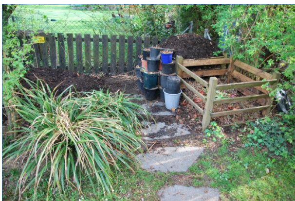
Abb. 24: Eigenkompostierung mit drei Haufen, die zwischen null und drei Jahre alt sind. Daneben wird Strauchschnitt gelagert, der unter Rasenschnitt gemischt wird, um diesen aufzulockern.

Organische Substanz zerfällt in der Natur ganz von selbst durch Oxidation (Sauerstoffeinwirkung; auch als „kalte Verbrennung“ bezeichnet). Außerdem dadurch, dass Bakterien, Pilze und eine Vielzahl an Kleintieren die organische Substanz zerlegen. Dabei wird die Energie frei, die als Sonnenenergie beim Wachstum zugeführt wurde. Es ist der ständige Kreislauf der Natur. Dieses Prinzip macht sich der Mensch zu Nutze und kompostiert seinen Rasen- und Strauchschnitt (Grüngut) sowie seine rohen Bioabfälle aus der Küche. Die freiwerdende Energie erwärmt den Komposthaufen.