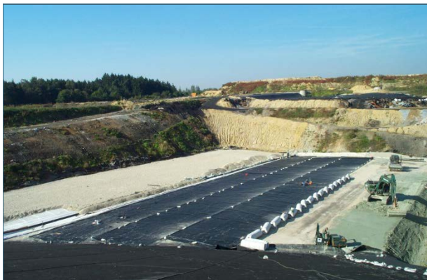
Abb. 31 Deponien werden heute mit mehreren Lagen und Elementen abgedichtet: Zunächst wird die mineralische Dichtung aufgebracht (grünlich, rechts im Bild). Darüber kommt die Kunststoffbahn aus hochverdichtetem Polyethylen (schwarz). Zu deren Schutz wird eine Sandmatte verlegt (weiße Rollen rechts bzw. weiße Fläche links). Am linken Bildrand erkennt man das in der Sandschicht liegende Dränagerohr, es wird an der tiefsten Stelle verlegt. Dränkies nimmt das Sickerwasser auf und schützt das Rohr. Das Sickerwasser wird geklärt.

jeweiligen Fachbehörden werden beteiligt. Unmittelbar betroffene Bürger haben die Möglichkeit, sich zur Planung zu äußern, der Planfeststellungsbeschluss wird konstruktive Einwände berücksichtigen.