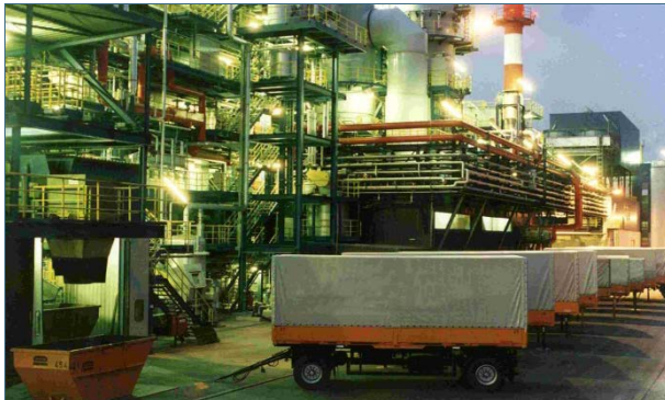
Abb. 34: Sonderabfallverbrennungs- anlage der gsb.

Das Bayerische Landesamt für Umwelt (LfU) ist mit seiner Zentralen Stelle Abfallüberwachung (ZSA) 33 die Behörde zur Überwachung der Entsorgung von Sonderabfällen in Bayern. Das LfU überwacht auch die Anlagen zur Beseitigung der Sonderabfälle. Auf Basis der Begleitscheine und Nachweislisten erstellt es regelmäßig die Sonderabfallstatistiken 34 .