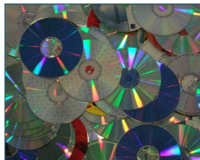
Abb. 27: Aus CD-Rezyklat können Produkte für die Computerindustrie oder für die Medizintechnik hergestellt werden.