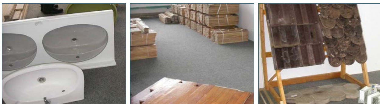
Abb. 11, 12, 13: Auf Bauteilbörsen kann man gebrauchte Teile für Bad, Fußboden und Dach sowie viele andere Positionen günstig kaufen.

Derzeit entsteht in Deutschland ein Netz von Bauteilbörsen, um auch immobile, weil eingebaut gewesene Bauteile aus der Baurestmasse wieder- oder weiterzuverwenden und dadurch Abfall zu vermeiden. Geeignet sind vor allem Einbauten, Freitreppen, Türen, Fenster, Innen- und Außenbodenbeläge wie Parkett und Trittsteine, Holzbalken, Ziegel, Dachschindeln, Glasbausteine, Fliesen und Kacheln (jeweils nur in relevanter Menge), Sanitäranlagen, Anbauten wie Wintergärten und Überdachungen, Zäune und vieles andere mehr.