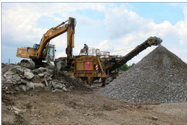
Abb. 21: Aufbereitung (Recycling) der Betonbahn eines ehemaligen Flugplatzes.

Das Recycling – auch als werkstoffliche Verwertung bezeichnet – ist die hochwertigste Form der Verwertung. Sie steht in der Abfall-Hierarchie vor der energetischen oder einer sonstigen stofflichen Verwertung. Recycling bedeutet, dass Wertstoffe aus Abfällen so lange wie möglich im Kreislauf gehalten werden. Der Kreislauf beginnt in der Regel mit der Produktion aus Primärrohstoffen, wird mit der Vermarktung der Produkte und deren Nutzung (von einem oder mehreren Besitzern) fortgesetzt, führt über die Entsorgung als Abfall zur Verwertung und damit zur Gewinnung von Sekundärrohstoffen für den erneuten Kreislauf. Das ist jedoch nur möglich, wenn dieser Kreislauf schadstofffrei gehalten wird.