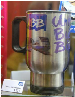
Abb. 7: Wer für das regelmäßige Coffee-to-go seinen eigenen Thermo- becher nutzt, vermeidet Abfälle.

Vielorts verleihen Kommunen und Vereine Geschirr, Besteck und Tischwäsche. So kann auf die Einwegvarianten verzichtet werden. Auch beim regelmäßigen Coffee-to-go lassen sich mit einem eigenen Thermobecher Zeichen setzen.