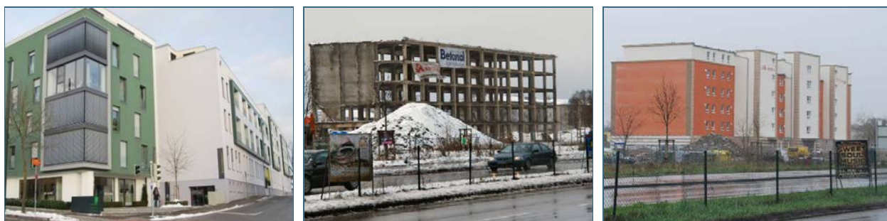
Abb. 8, 9, 10: Bei der Sanierung lässt sich nachhaltig Bauschutt vermeiden, wenn das alte Gebäude weitestgehend erhalten und modernisiert (Bild links) oder nur teilweise erhalten wird. Aus der bewahrten Stahlskeletstruktur eines Kasernenbaus (Bild Mitte) entstand ein modernes Heim für betreutes Wohnen (Bild rechts).

Das Statistische Bundesamt (Destatis) ermittelte in der Abfallbilanz 2010 für Deutschland pro Einwohner und Jahr allein 658 kg Beton, Ziegel, Fliesen und Keramik als Teilfraktion aus dem noch viel größeren Bau- und Abbruch-Abfallspektrum. Entsprechend dringend ist es, Konzepte zu entwickeln, um auch Bauabfälle zu vermeiden oder – wenn doch abgebrochen werden muss – sortenrein zu erfassen, aufzubereiten und wieder als Baustoff einzusetzen.