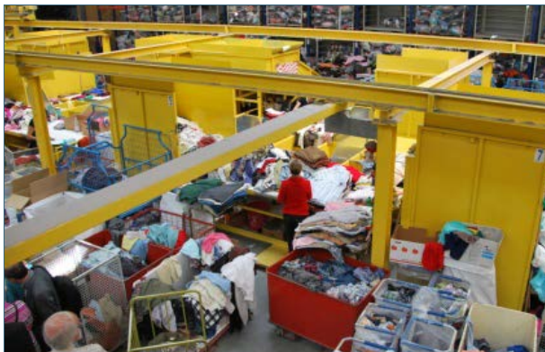
Abb. 14: Gebrauchtkleidersortierung in einem der größeren deutschen Sortierfachbetriebe.

Saubere Bekleidung kann auch über Kleidercontainer oder Straßensammlungen karitativ-gemeinnütziger oder gewerblicher Betriebe weitergegeben werden. Es muss jedoch zu erkennen sein, wer für die Kleidersammlung verantwortlich ist. Wenn keine vollständige Adresse angegeben ist, sondern nur Telefon- oder Handynummern, unter denen dann niemand zu erreichen ist, oder Hilfsorganisationen aus weit entfernten Regionen genannt werden, ist Vorsicht geboten. Dieses Sammelgut geht häufig unsortiert und damit als Abfall auch illegal ins Ausland. In Deutschland gibt es eine ganze Reihe Sortierfachbetriebe, die Kleider, Schuhe etc. hochqualifiziert sortieren und einer weiteren Verwendung oder Verwertung zuführen. Bis zu 50% der Kleider und Schuhe können wieder verwendet – und damit letztlich als Abfall vermieden – werden.