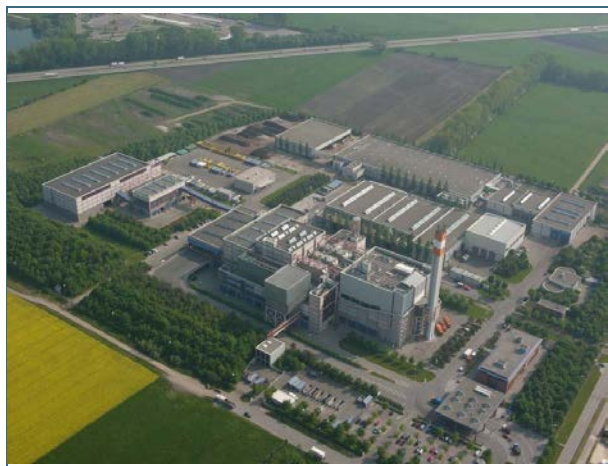
Abb. 29: Abfallverwertungsanlage Augsburg (AVA)

Von 1.000 kg Abfall verbleiben nach der Verbrennung durchschnittlich rund 240 kg Aschen und Schlacken sowie 15 kg Filterstaub und Reaktionsprodukte (Rückstände der Rauchgasreinigung).