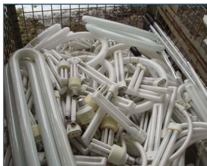
Abb. 26: Energiesparlampen und Leuchtstoffröhren enthalten viele Wertstoffe, die für neue Produkte benötigt werden.