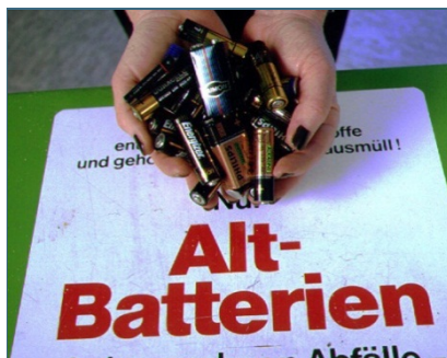
Abb. 25: Aus Batterien werden Metalle wie Nickel und Blei gewonnen. Zink aus Zink-Kohle-Batterien lässt sich z. B. für die Herstellung von Sonnencreme verwenden.