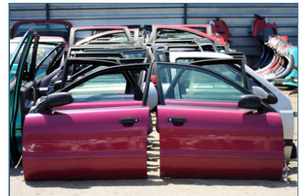
Abb. 3: Vorbereitung zur Wiederverwendung: Gebrauchte Autoteile werden ausgebaut. Statt sie zu pressen und zu schreddern, können sie wiederverwendet werden.

Vorbereitung zur Wiederverwendung bedeutet, dass etwas, was bereits zu Abfall geworden ist, weil es nicht mehr benötigt und entsorgt wurde, durch Prüfung (z. B. Sortierung), Reinigung oder Reparatur (auch unter Einbau gebrauchter Teile) ganz oder teilweise einer erneuten Verwendung zugeführt werden kann. Beispiele sind Gegenstände oder Materialien aus dem Sperrmüll, Geräte oder Fahrzeuge (auch Fahrräder), die demontiert und als Einzelteile zur Wiederverwendung vorbereitet werden. Damit wird letztlich Abfall vermieden.