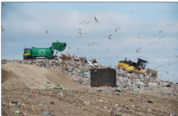
Abb. 32: Unbehandelte Siedlungsabfälle, wie hier auf einer Deponie in Tallinn/Estland, dürfen in Deutschland seit 2005 nicht mehr deponiert werden.

Im Jahr 2010 wurden in Bayern nur noch 33 kg Abfall pro Einwohner und Jahr auf Deponien der Klassen 1 und 2 deponiert. Diese Menge schließt auch belasteten Bauschutt, belastetes Erdreich und asbesthaltige oder (künstliche) mineralfaserhaltige Abfälle mit ein.