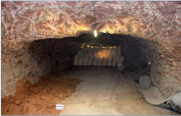
Abb. 28: Um Bergschäden zu vermeiden, nutzt man für den „Bergversatz“ nur standfeste Abfälle.