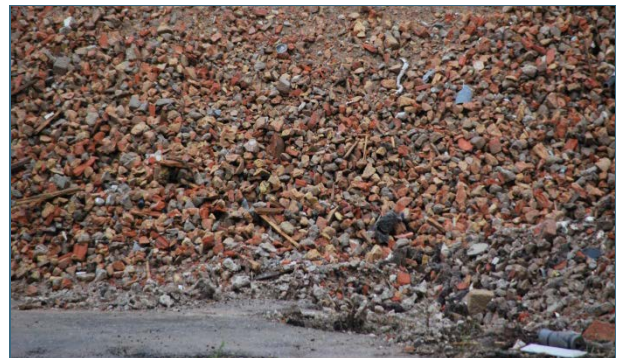
Abb. 19, 20: Ein Abbruch ganzer Häuser mit dem Bagger führt zu Gemischen mineralischer Abfälle, aus denen in der Regel nichts Hochwertiges mehr hergestellt werden kann.