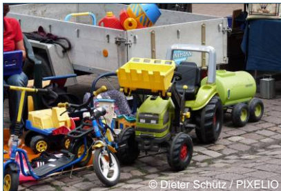
Abb. 1: Wiederverwendung: Gebrauchte Spielsachen finden z. B. auf dem Flohmarkt neue Besitzer.

Voraussetzung für die Wieder- oder Weiterverwendung sind langlebige Produkte. Deshalb sollte beim Kauf auf gute Qualität geachtet und das erworbene Produkt auch gepflegt werden. Dann besteht die Chance, dass es vom Erstbesitzer lange verwendet oder von weiteren Besitzern wiederverwendet werden kann. Je länger ein Produkt im Umlauf ist, desto effizienter werden die bei der Produktion eingesetzten Ressourcen genutzt. Umwelteingriffe, die bei der Produktion zwangsläufig erfolgten, können besser verantwortet werden, neue primäre Ressourcen (Bodenschätze) bleiben geschont. Abfallvermeidung stößt jedoch an Grenzen, sobald es dank neuer Erkenntnisse oder eines besseren Standes der Technik bereits umweltfreundlichere Produkte gibt, die deutlich weniger Schadstoffe abgeben (wie neue Kraftfahrzeuge) oder weniger Energie verbrauchen (wie Kühlschränke mit klimafreundlichem Kühlmittel).