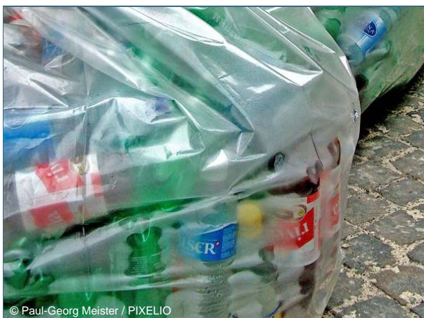
Abb. 22: Beispiel für ein perfektes Recycling ist die Herstellung neuer PET-Flaschen aus alten PET-Flaschen (Polyethylenterephthalat). 23

Deshalb – und um wieder handhabbare „Bausteine“ zu gewinnen – werden die Wertstoffe zuvor aufbereitet 22 . Beispielsweise werden Beton und Glas gebrochen (s. Abb. 21) und gewaschen, Kunststoffe geschreddert, gewaschen und granuliert. Kraftfahrzeuge werden nach Trockenlegung und Verdichtung in einer Presse geschreddert und in den einzelnen Fraktionen sortenrein erfasst. Alttextilien werden gerissen und geschnitten oder es werden Wollfäden gewonnen. Papier wird aufgelöst, von den Druckfarben befreit und gebleicht. Unbehandeltes bzw. naturbelassenes Altholz wird geschreddert, mit Bindemittel versetzt und zu Spanplatten verpresst. Lösemittel, Säuren, Basen und Öle werden regeneriert. Brennbare Abfälle werden als Ersatzbrennstoff zu der vom Kunden (z. B. einem Zementwerk) gewünschten Mischung zusammengestellt.