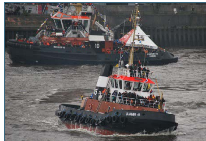
Abb. 2: Weiterverwendung: Als Autoreifen haben sie ausgedient, als Prallschutz an Schiff oder Kai leisten sie aber noch gute Dienste.