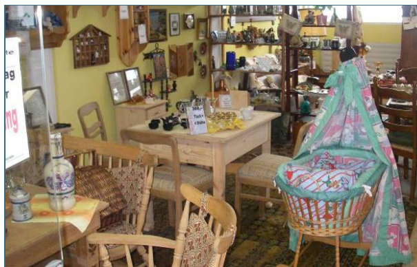
Abb. 15, 16: Egal ob Kleider, Spielsachen, Geschirr, Bücher oder Möbel – in Gebrauchtwarenläden findet man gut Erhaltenes zu Flohmarktpreisen. Diese Läden brauchen auch Nachschub!