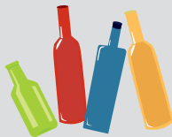
grünes, blaues, rotes, gelbes Glas